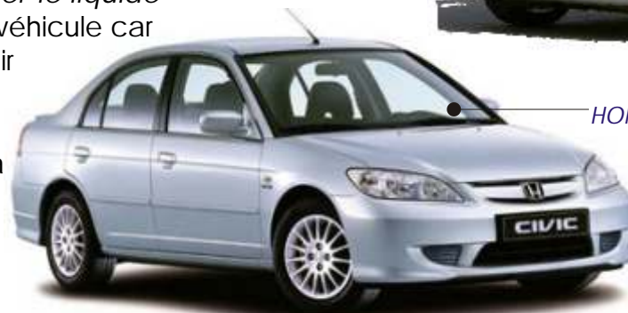
HONDA Civic TOYOTA Prius